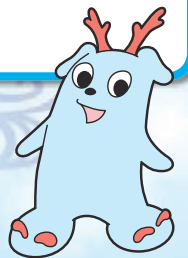
沖縄産業保健総合支援センター イメージキャラクター さんぼん